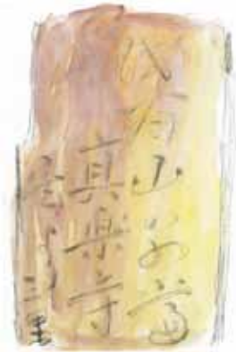
スケッチ:大工原照富氏