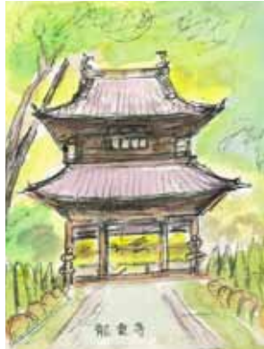
スケッチ:大工原照富氏