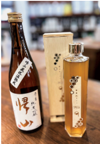
帰山と軽井沢ミード。軽井沢ミードは蜂の巣をモチーフにした六角形のボトル、箱は巣箱をイメージしたユニークなものとなっている。

たとえば「帰山」という日本酒は、四半世紀前に開発・販売されて以来、営業サイドから多様化した酒質のニーズに応えるため、番外編など新たな商品開発に取り組み商品化しました。また、佐久地域の酒米を使った純米酒を飲食店限定で開発・販売し、地元のお料理とともに楽しむ商品としました。