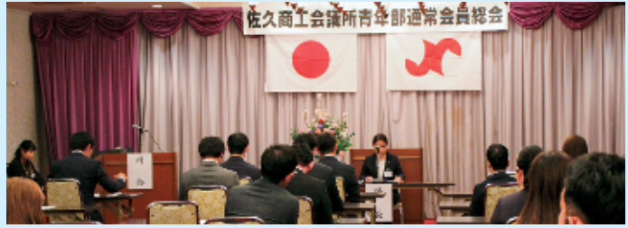
総会での協議の様子

その後、卒業例会が行われ、これまで青年部活動に大きく貢献された8名の皆様が青年部を卒業しました。卒業例会では5名の卒業生が出席され、これまでのご自身の青年部活動の振り返りや感謝の言葉、これからを担う青年部会員への思いを述べました。