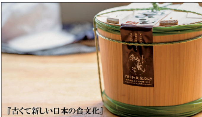
『古くて新しい日本の食文化』