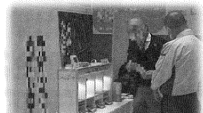
展示スペースを活用して企業PRを！ ※昨年度の展示スペースの様子

エントリー企業限定で、商談会当日の会場内に製品や商品、パンフレット等展示するスペースを設けます。来場される方に対して、製品や商品を紹介するチャンスです。