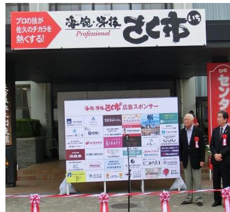
「スポンサーボード」イメージ